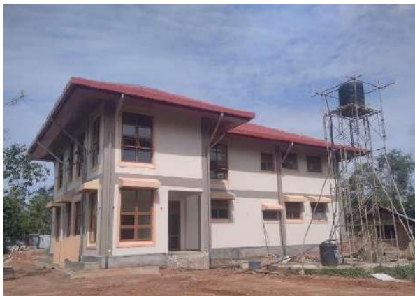
දිවා සුරැකුම් මධ්‍යස්ථානය, වයඹ විශ්වවිද්‍යාලය - කුලියාපිටිය පරිශ්‍රය

සංවර්ධනය සඳහා වන සෞදි අරමුදල (SFD) සෞදි රියාල් මිලියන 105ක සහන ණයක් යටතේ ක්‍රියාත්මක වන වයඹ විශ්වවිද්‍යාල නගර සංවර්ධන ව්‍යාපෘතියේ ඇස්තමේන්තුගත වියදම ඇමරිකානු ඩොලර් මිලියන 28 ක් වේ (රු.මි.4,088). “වයඹ විශ්ව විද්‍යාල නගර සංවර්ධන වැඩසටහන” අවට විශ්වවිද්‍යාල ප්‍රජාව සමඟ සමීප අන්තර් ක්‍රියාකාරීත්වය වැඩි දියුණු කිරීම මෙන්ම ග්‍රාමීය ප්‍රදේශ ශක්තිමත් කිරීම තුළින් සැලකිය යුතු සංවර්ධන බලපෑමක් ඇතිකිරීමේ අරමුණින් යුත් නවතම සංකල්පයකි. මෙම ව්‍යාපෘතිය විශ්වවිද්‍යාලයේ අධ්‍යාපන පහසුකම් සහ යටිතල පහසුකම් සංවර්ධනය මෙන්ම විශ්වවිද්‍යාල ආසන්න ප්‍රදේශයේ වෙසෙන ජනතාවගේ ජීවනෝපාය නංවාලීම සඳහා සැලසුම් කර ඇත. ව්‍යාපෘතියේ ප්‍රධාන අරමුණුවන්නේ ශ්‍රී ලංකා වයඹ විශ්වවිද්‍යාලය සඳහා දැනුම පදනම් කරගත් ස්වයං-විශ්වාස සහ නිරසාර ප්‍රජා අන්තර් ක්‍රියාකාරී පද්ධතියක් ස්ථාපිත කිරීමයි. මෙම වයඹ විශ්ව විද්‍යාලයීය නගර සංවර්ධන ව්‍යාපෘතිය විශ්වවිද්‍යාලයේ කුලියාපිටිය පරිශ්‍රය සහ මාකඳුර පරිශ්‍රය ආවරණය කරයි. 2023 වර්ෂයේ මෙම ව්‍යාපෘතිය සඳහා රු.මිලියන 2565ක ප්‍රතිපාදන ලබා දුන් අතර සමස්ත භෞතික ප්‍රගතිය 83.05%කි.