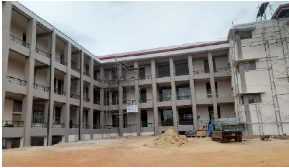
පුස්තකාල ගොඩනැගිල්ල, වයඹ විශ්වවිද්‍යාලය - කුලියාපිටිය පරිශ්‍රය