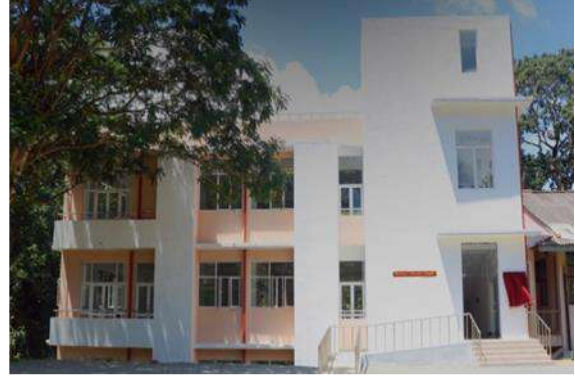
සේනක බිබිල ගොඩනැගිල්ල, සම සෞඛ්‍ය විද්‍යා පීඨය, ජේරාදෙණිය විශ්වවිද්‍යාලය