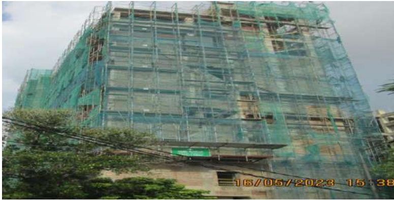
වෛද්‍ය පීඨය සඳහා මහාවාර්ය ඒකකයක් ඉදිකිරීමේ ව්‍යාපෘතිය, රුහුණ විශ්වවිද්‍යාලය