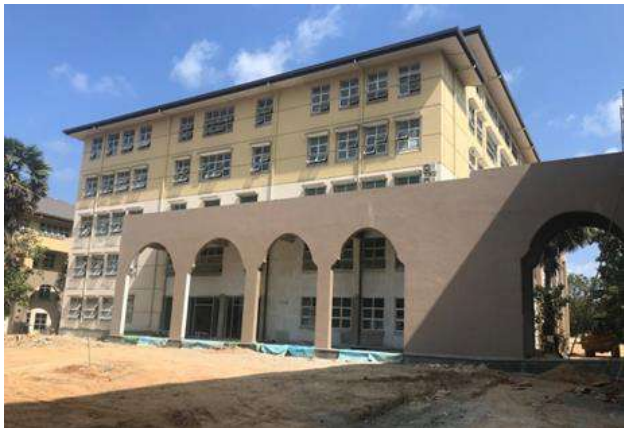
සායනික විද්‍යා දෙපාර්තමේන්තුව සහ අතිරේක සෞඛ්‍ය විද්‍යා දෙපාර්තමේන්තුව