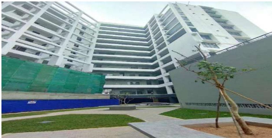
පරිගණක තාක්ෂණ පීඨයේ ගොඩනැගිලි සහ යටිතල පහසුකම් සැලසුම් කිරීම සහ ඉදිකිරීම, කැලණිය විශ්වවිද්‍යාලය

මෙම ව්‍යාපෘතිය යටතේ තෝරාගත් පර්යේෂණ ව්‍යාපෘති යෝජනා 22ක් සඳහා අරමුදල් ලබා දී ඇති අතර ඒවා දැන් විශ්වවිද්‍යාල මට්ටමින් ක්‍රියාත්මක වෙමින් පවතී.