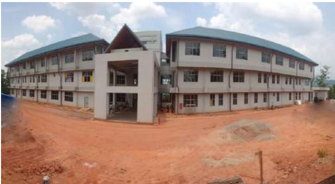
පැරා සායනික නව ගොඩනැගිල්ල හා පරිපාලන ගොඩනැගිල්ල - සබරගමුව විශ්වවිද්‍යාලය

පළමු අදියර - මෙම අදියර දේශීය අරමුදල් යටතේ මූල්‍යනය කරන අතර මුළු පිරිවැය අගය රුපියල් මිලියන 3,070කි. මේ වන විට ඉදි කිරීම් සිදු කරන මෙම ව්‍යාපෘතිය වෙනුවෙන් 2023 වර්ෂය දී රුපියල් මිලියන 610ක් වෙන් කර ඇති අතර එම මුදලින් 2023.12.31 වන විට රුපියල් මිලියන 609.58ක මුදලක් වියදම් කර ඇති අතර 2023.12.31 දින වන විට දරා ඇති සමුච්චිත වියදම රුපියල් මිලියන 1,237.96කි. 2023.12.31 වන විට ව්‍යාපෘතියේ භෞතික ප්‍රගතිය 100%ක මට්ටමක පවතී.