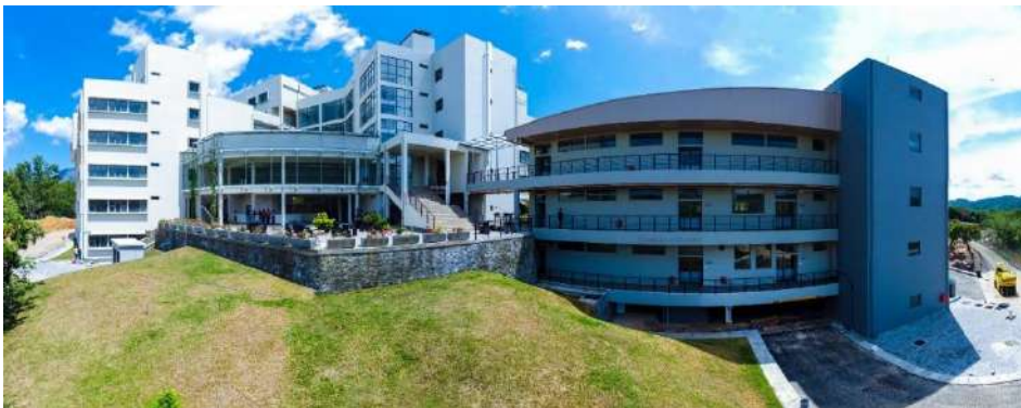
තාක්ෂණ පීඨය සඳහා ගොඩනැගිලි සහ යටිතල පහසුකම් සැලසුම් කිරීම සහ ඉදිකිරීම, සබරගමුව විශ්වවිද්‍යාලය