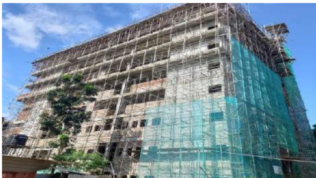
වෛද්‍ය පීඨය සඳහා තට්ටු දොළහක ගොඩනැගිලි සංකීර්ණය ඉදිකිරීමේ ව්‍යාපෘතිය, රුහුණ විශ්වවිද්‍යාලය

2017 වසරේ අයවැය යෝජනාවක් මත ක්‍රියාත්මක වන මෙම ව්‍යාපෘතියේ මුළු පිරිවැය රුපියල් මිලියන 1,179 කි. වර්ග මීටර් 8,199ක වපසරියකින් යුක්ත වූ ව්‍යාපෘතිය සඳහා 2023 වර්ෂය වෙනුවෙන් රුපියල් මිලියන 675 ක් වෙන් කර ඇති අතර 2023.12.31 වන විට රුපියල් මිලියන 174.2 වියදම් කර ඇත. 2023.12.31 දින වන විට දරා ඇති සමුච්චිත වියදම රුපියල් මිලියන 1009.48කි. පළමු කොන්ත්‍රාත්කරුට වැඩ ආරම්භ කිරීමේ අත්තිකාරම ලෙස 2018.01.17 දින රුපියල් මිලියන 187ක මුදලක් ලබා දී තිබූ අතර ව්‍යාපෘතිය ක්‍රියාත්මක කිරීමේ අඩු ප්‍රගතිය නිසා 2019.12.23 දින පළමු කොන්ත්‍රාත් ගිවිසුම අවලංගු කර 2020.07.09 වන දින ව්‍යාපෘතිය නව කොන්ත්‍රාත් සමාගමකට ප්‍රදානය කරන ලදී. 2023 වසරේ දෙසැම්බර් මස 31 දින වන විට 50.5% ක භෞතික ප්‍රගතියක් අත් කර ගෙන ඇත. ව්‍යාපෘතිය නිම කිරීමෙන් පසු ඇතුළත් කර ගන්නා වෛද්‍ය සිසුන් සංඛ්‍යාව 160 සිට වසරකට සිසුන් 10 බැගින් වසර 4ක් තුළදී සිසුන් 40කින් වැඩි කර වාර්ෂිකව ඇතුළත් කර ගන්නා සිසුන් ගණන 200ක් කිරීමට යෝජිතය.