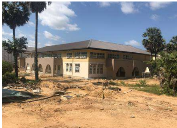
පුස්තකාලය සහ ස්වයං ඉගෙනුම් පහසුකම්

මෙම පීඨය පිහිටා ඇති පරිශ්‍රය අක්කර 50කින් යුක්තවේ. සම්පූර්ණ පීඨය ගොඩනැගිලි 17 කින් යුක්තවේ. මෙහි භෞතික ප්‍රගතිය 85% ක් වන අතර අරාබි ආර්ථික සංවර්ධනය සඳහා වූ කුවේට් අරමුදල මගින් ණය ලබාදීම නතර කිරීම නිසා තාවකාලිකව මේවනවිට ව්‍යාපෘතිය ක්‍රියාත්මක නොවේ.