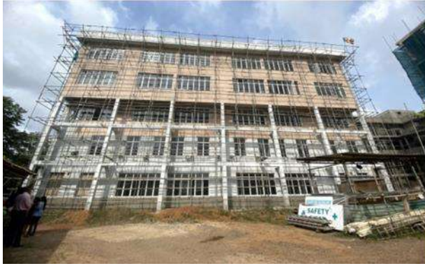
නැනෝ විද්‍යා තාක්ෂණ ගොඩනැගිල්ල, තාක්ෂණ පීඨය, වයඹ විශ්වවිද්‍යාලය